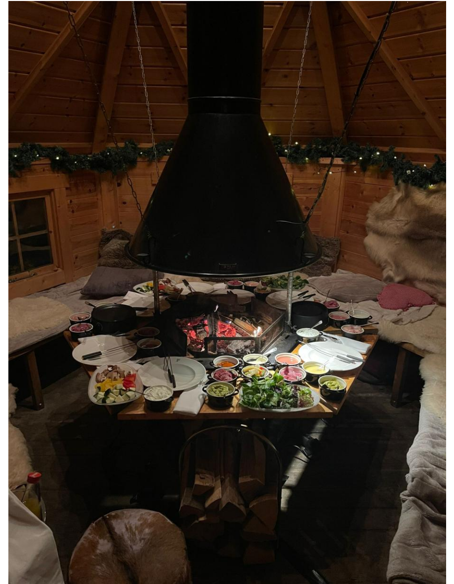
FONDUE IN DER KAMINHÜTTE ALS IMPRESSION

€ 93,00 pro Person inkl. Empfangsgetränke und Hüttenschnittchen, 5 Stunden Getränkepauschale sowie angebotene Speisenvariante