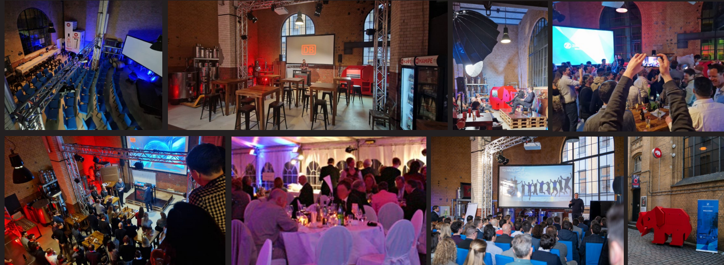
150 Personen auf 3 Levels inkl. Dachterrasse und Industriedhof - 150 people on 3 levels, on the rooftop, and the courtyard