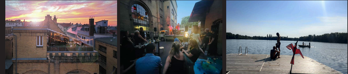
140m 2 , 250m 2 , 40.000m 2 : Fernsehturmblick, Lagerfeuerromantik, Freiheit- 140, 250 & 40.000m 2 : TV-Tower view. campfire, freedom