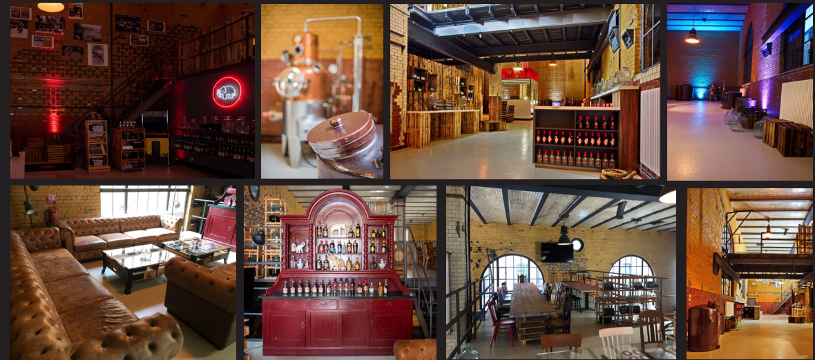
400m 2 , ungeahnte Möglichkeiten, keine Catering-, Technik-bindung - 400m 2 , unimagined possibilities, no commitment reg. Catering,...