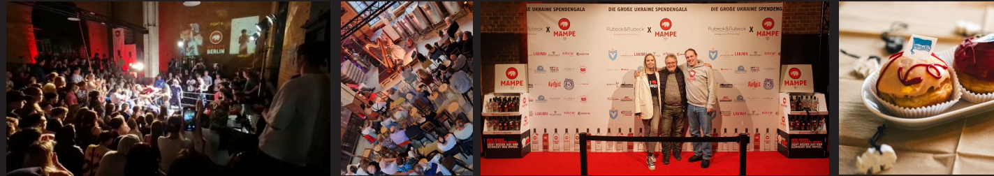
300 Gäste zum Boxen, Harfenkonzert oder Spendengala inkl. Outdoor-Option – 350 guests for a boxing event, a harp concert or fundraising gala incl. outdoor area