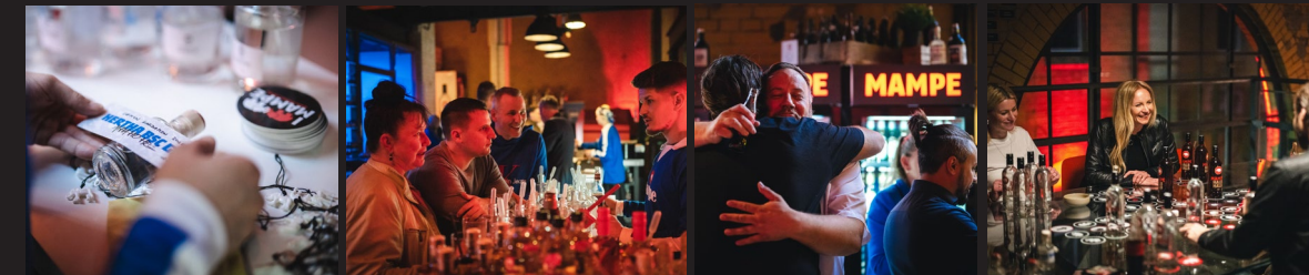
Mach deinen eigenen Gin, diverse Tastings, Spiele & Wettbewerbe – make your own gin, various tastings, games, and competitions