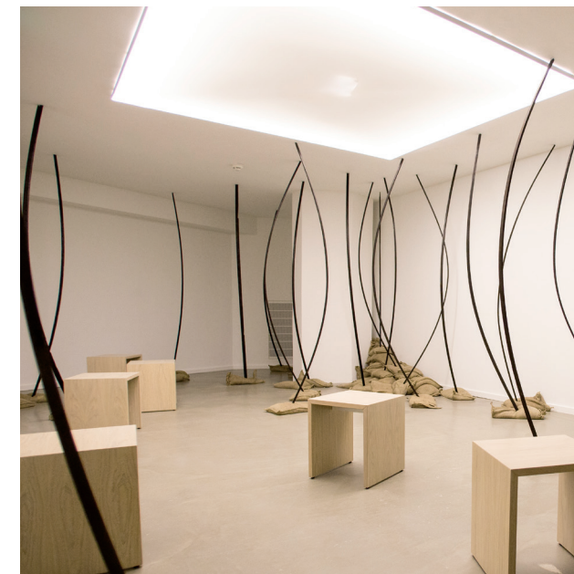
Andachtsraum Inspirierende Atmosphäre: für die innere Einkehr ebenso wie für liturgische Feiern.