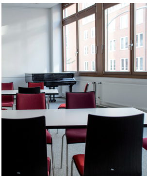
Seminarräume 1 und 2 Flexibel bestuhlbar für jeden Anlass: Konferenz, Seminar, Vortrag, Workshop.