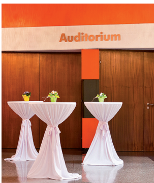
Großes Foyer und kleines Foyer Von festlich bis offen: Beide Foyers sind für viele Veranstaltungskonzepte ideal.