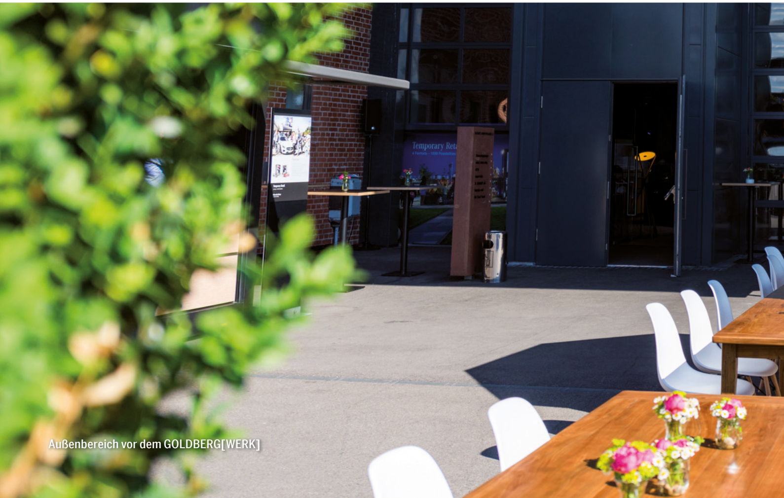
Außenbereich vor dem GOLDBERG[WERK]