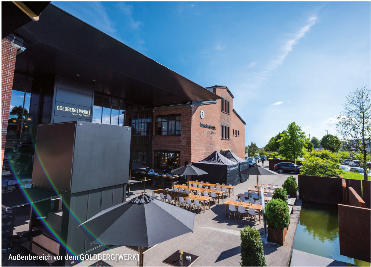
Außenbereich vor dem GOLDBERG[WERK]