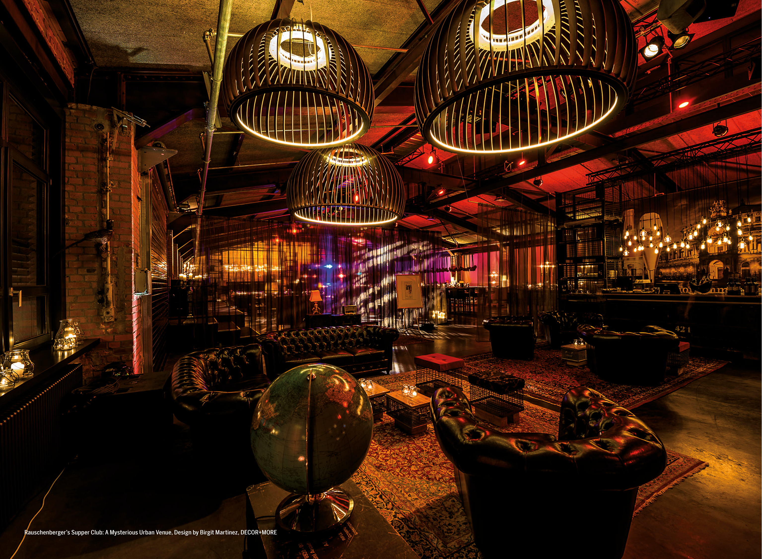
Rauschenberger's Supper Club: A Mysterious Urban Venue, Design by Birgit Martinez, DECOR+MORE