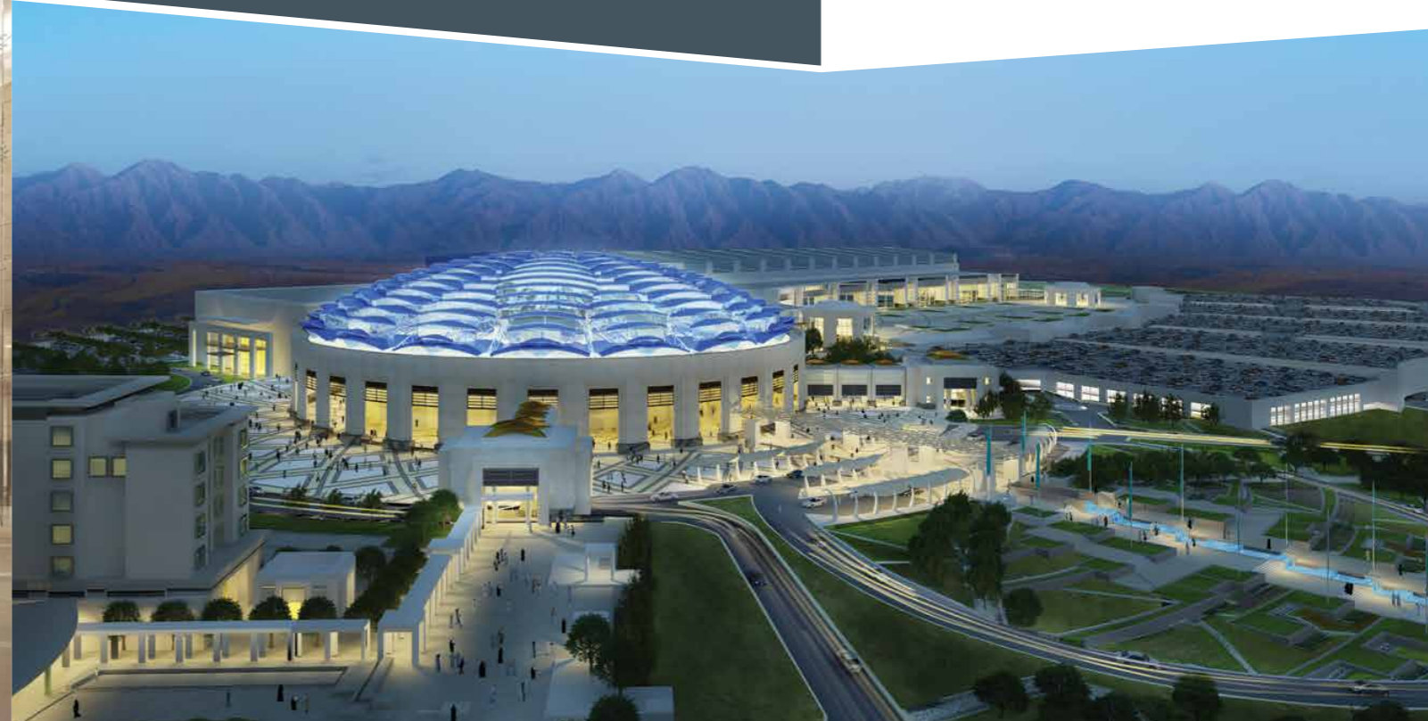
Aerial View | منظر جوي