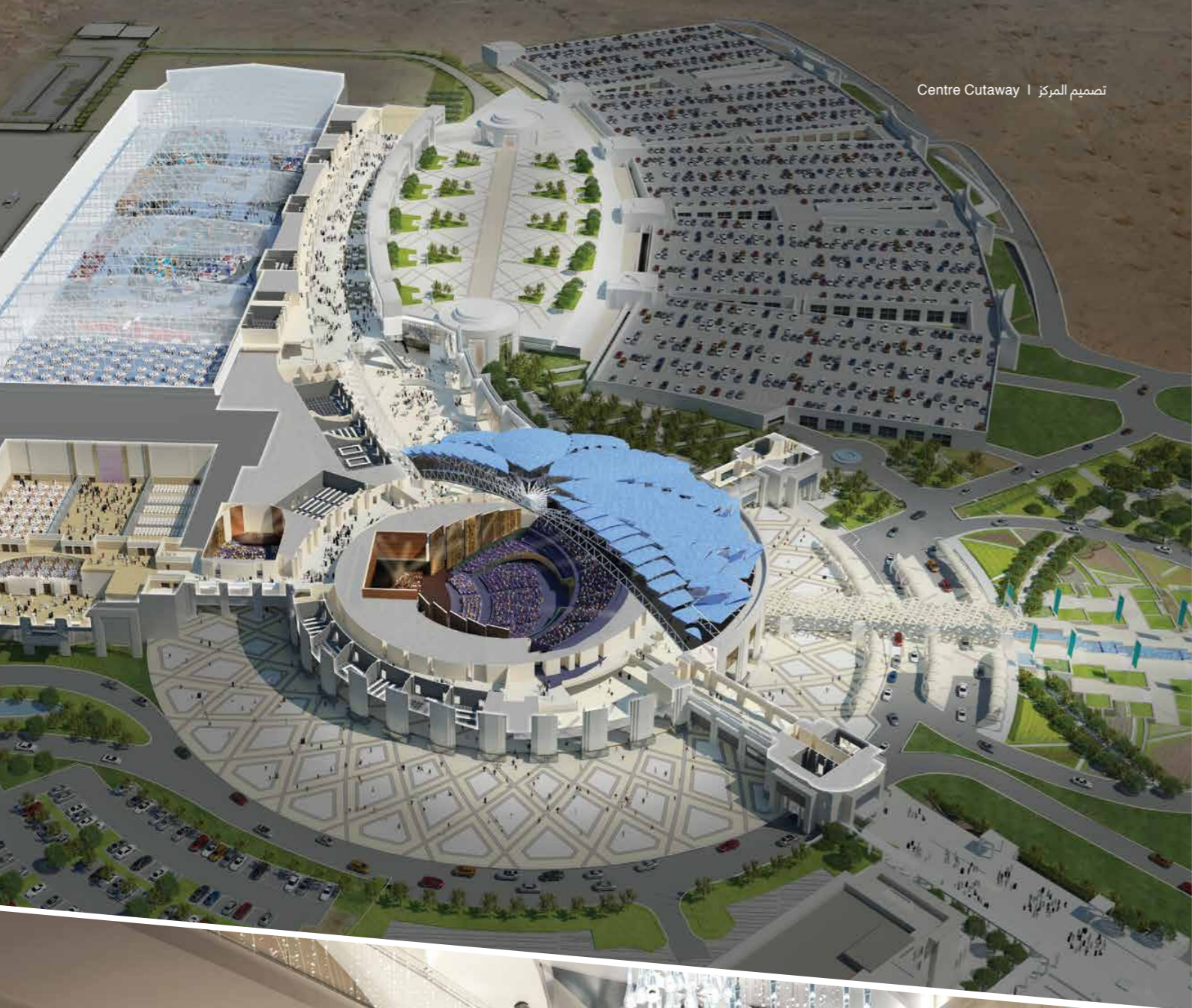
Centre Cutaway | تصميم المركز